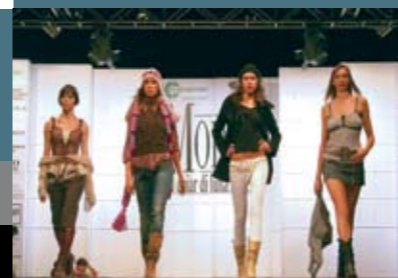
A Piove di Sacco Katuscia ha collaborato con Confesercenti nell'organizzazione di una sfilata "al chiaro di luna".

In www.amicidellazip.it come iscriversi all'Associazione