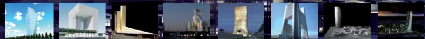
PEI-COBB-FREED & PARTNERS ARCHITECTS LLP

sceita di questo progetto (l'impressione comune è comunque che tutti gli elaborati selezionati dimostrino un'elevata qualità di idee costruttive) è stato fatto un ulteriore passo particolarmente significativo verso la realizzazione del nuovo “Parco della Ricerca Applicata” nell'area finora occupata dal Cnr e dal Consorzio Rfx. Al vincitore finale del Concorso è andata la somma di 100 mila euro a titolo di premio, mentre gli altri concorrenti selezionati hanno ricevuto 25 mila euro a titolo di rimborso spese. Il costo complessivo dell'opera è valutato sugli 85 milioni di euro. Nelle prossime settimane il Consorzio Zip presenterà i nove progetti alla cittadinanza tramite una mostra e una pubblicazione. [Ulteriori informazioni in www.zip.padova.it ]