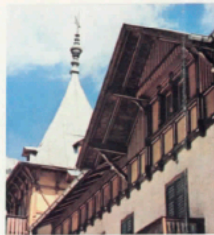
Le case del villaggio sono in pietra e legno con balconcini.

re shopping e vita mondana nella vicina e famosissima Cortina. In più lo scenario incantevole permette di scegliere ogni giorno una meta diversa per piccole escursioni in macchina. Bastano infatti pochi minuti per raggiungere i paesi più belli, le rive di laghi splendidi, per inoltrarsi nei parchi naturali della zona, per oltrepassare il confine austriaco e continuare su comode strade sino alle città più famose come Innsbruck e Salisburgo. Ogni acquirente può com-