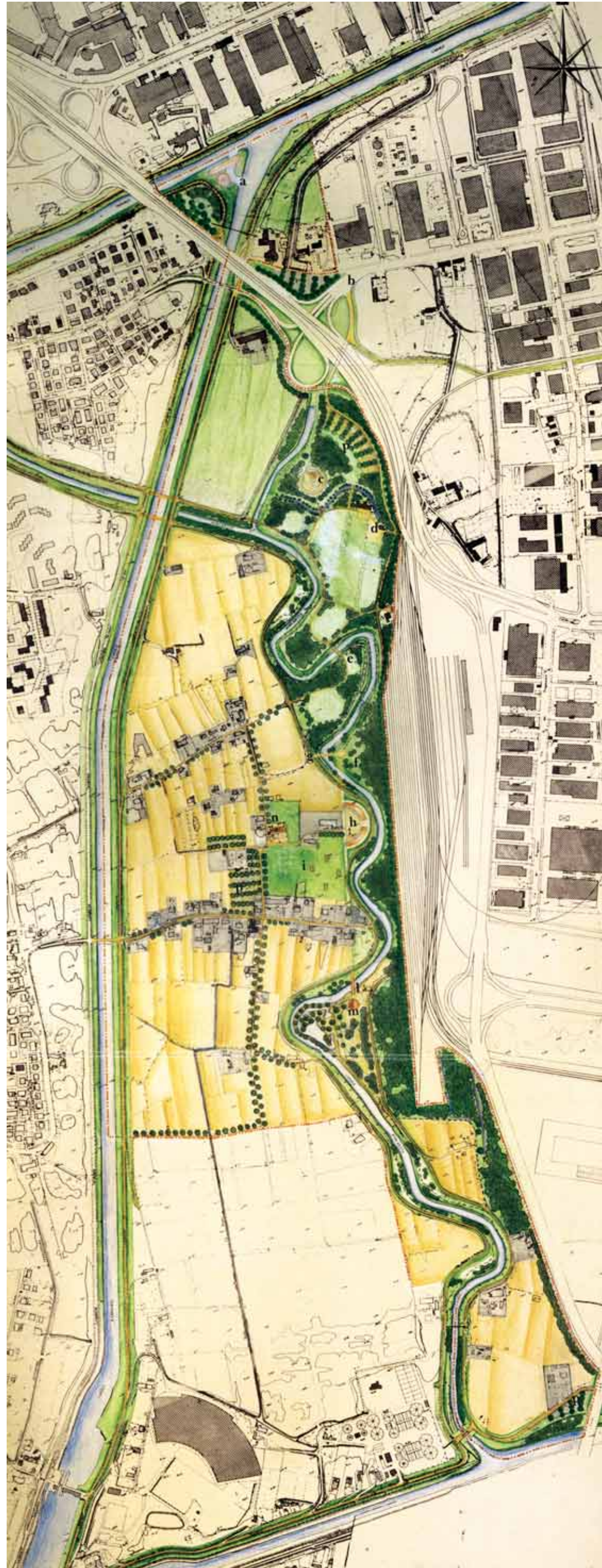
RONCAJETTE PARK PLAN BY FILIPPO PECCHINI

ALL ILLUSTRATIONS ARE FROM THE BOOK RITORNO AI RONCAJETTE . Abrami, Giovanni; Ballo, Mariangela; Meneghini, Costantino; Pecchini, Filippo. Ritorno ai Roncajette . Interporto Merzi Padova S.p.a. Consorzio Zona Industriale e Porto Fluviale di Padova Euganea Editoriale Comunicazioni srl - Padova March, 1990.